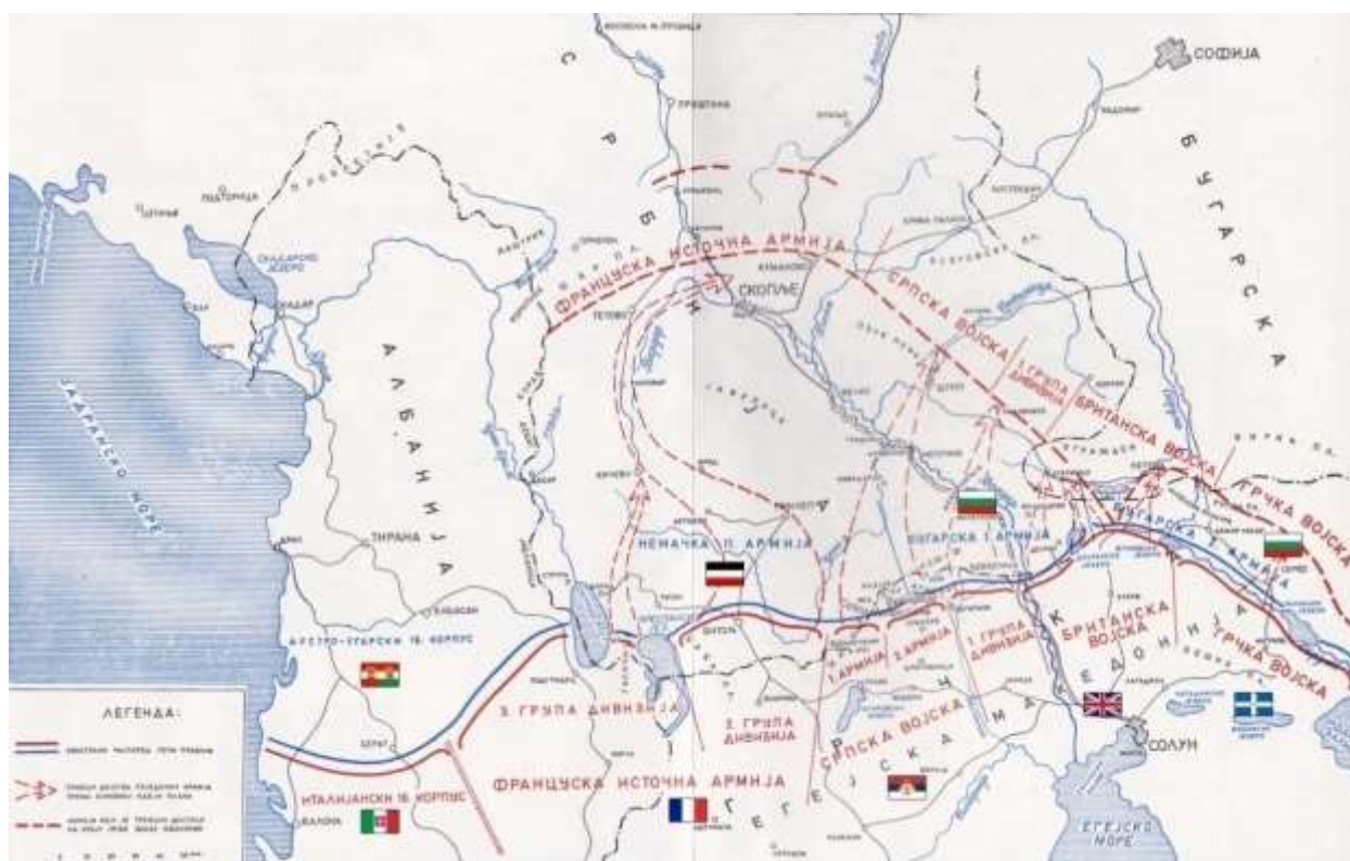
Пробој солунског фронта 1918.године

Осим ове тематске изложбе,установа је поклонила пажњу и за сам 8.март,где се путем страница које се воде наши посетиоци информишу о најважнијим подацима и о кратком историјату о борбама жена за своје право током прошлости.Такође,интернет странице имају задатак да представе најважније о предстојећим активностима установе.Од осталих тематских изложби у току године потребно је напоменути једну од важнијих,јер је у питању новије државно празновање,а реч је о Дану српског јединства,слободе и националне заставе.У питању је један од најважнијих датума и догађаја у току Првог светског рата,а то је пробој солунског фронта.У току Првог светског рата,тачније у његовој завршној фази долази до овог значајног догађаја,а како би се то обележило на достојан начин уведен је овај значајан датум из наше прошлости.