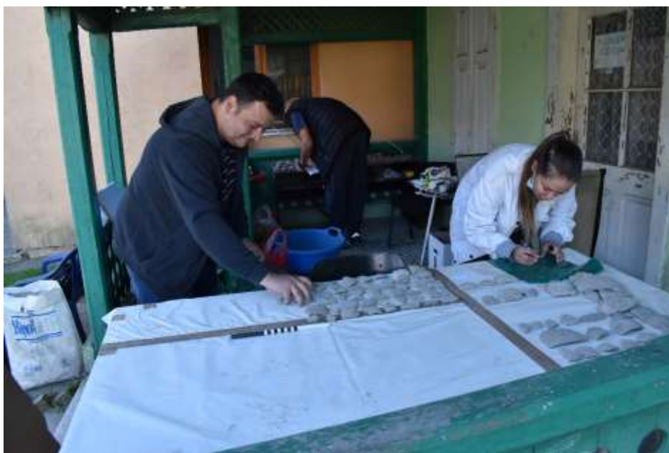
Обрада материјала са старих ископавања Доње Брањевине

Пројекти: Ове године Музејској јединици одобрена су средства за реализацију пројекта „Набавка пластичних кутија за складиштење археолошког материјала“ од стране Покрајинског секретаријата за културу. Пројекат је успешно реализован, а набавком ових кутија један део археолошког материјала из наше установе ће бити адекватно складиштен. Музејска јединца је и ове године учествовала у пројекту који финансира Министарство културе а који се односи на археолошка ископавања локалитета Доња Брањевина. Услед непредвиђених околности ископавања нису обављена у 2023. години већ су одложена за пролеће 2024. године, али је пројекат делимично реализован обрадом археолошког материјала са старијих ископавања Доње Брањевине.