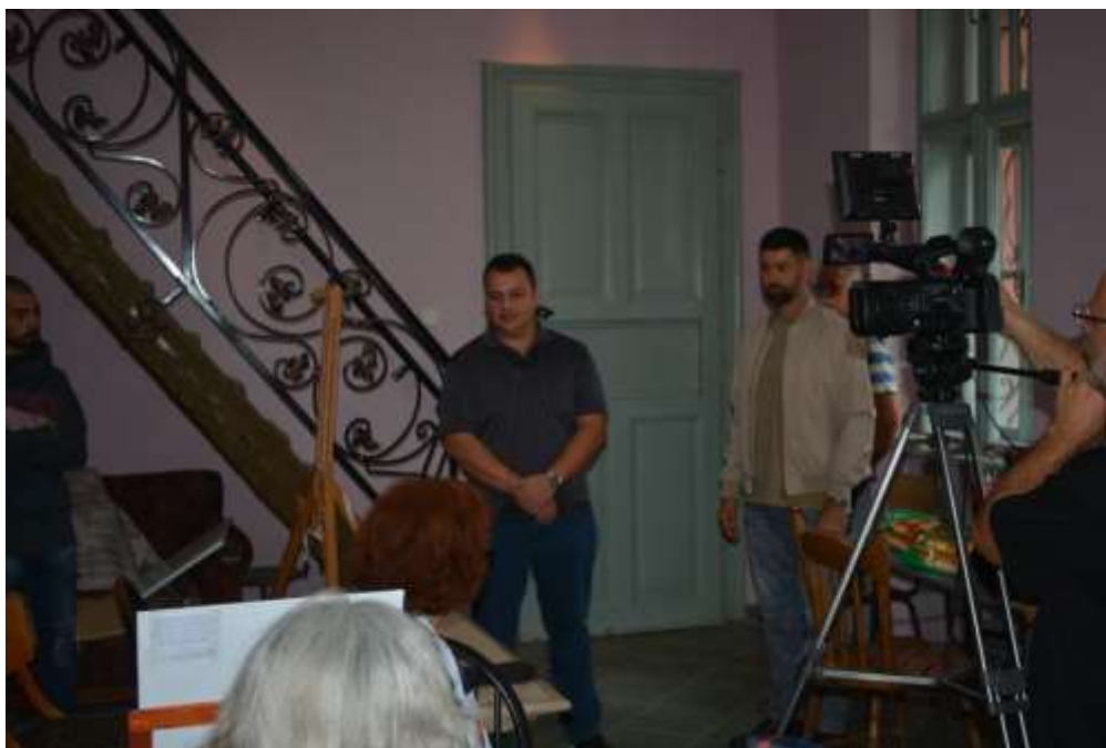
Ликовна колонија „Рафаило Момчиловић“

Манифестације: Музејска јединица је и ове године учествовала у манифестацији „Дани црвенокосе богиње“ чије званично отварање је обављено у изложбеном простору Музејске јединице. Окупљеној публици је представљен значај „Црвенокосе богиње“ али и самог локалитета Доња Брањевина. У оквиру одржавања ликовне колоније „Рафаило Момчиловић“ кустос-археолог Музејске јединице је учесницима колоније одржао предавање о локалитету Доња Брањевина и њеном значају у научним круговима.