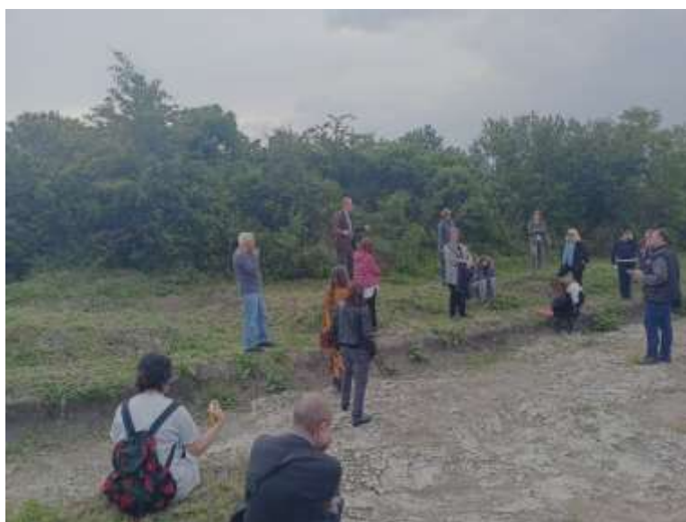
Чланови ICOMOS-а у посети локалитета Доња Брањевина

Рад са публиком: Током 2023. године Музејску јединицу посећивале су углавном групе ученика из локалних школа, основних и средњих као и деца из вртића. Осим тога посете су углавном биле појединачне или у мањим групама, а најчешће су то били туристи из земље и иностранства, али и локално становништво које је заинтересовано за прошлост свога завичаја. Током летњег периода археолошки локалитет Доња Брањевина посетили су стручњаци из организације ICOMOS која окупља запослене у установама заштите непокретних културних добара. Такође локалитет су посетили и чланови UNESCO организације, с обзиром да локалитет Доња Брањевина као и један део територије општине Оџаци конкурише за UNESCO-ву листу светске баштине у склопу номинације „Културни предео Бача“. Доња Брањевина у овом пројекту има значајну улогу јер сведочи о континуитету насељавања ових простора још од раног неолита. Осим локалитета Доња Брањевина са територије Оџаци планирано заштићено подручје обувата и село Дероње као и један део Каравуковачког атара.